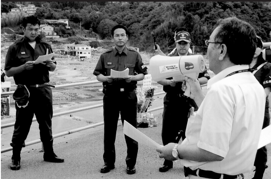
7月13日、家屋が流された被災地をバックに役場職員から被災状況の説明を受ける(宮城県女川町)