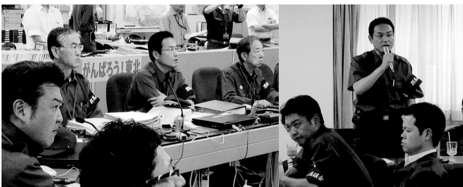
7月13日、国交省東北地方整備局で津波到達時の生々しい未公開ビデオを見る(宮城県仙台市)